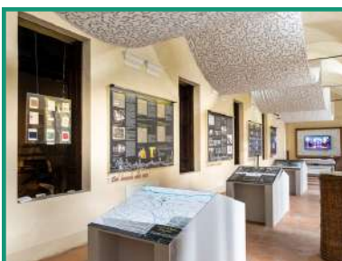
RACCONIGI MUSEO DELLA CIVILTÀ DELLA SETA