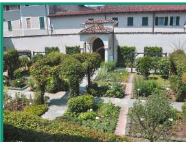
CHERASCO GIARDINO DEI SEMPLICI