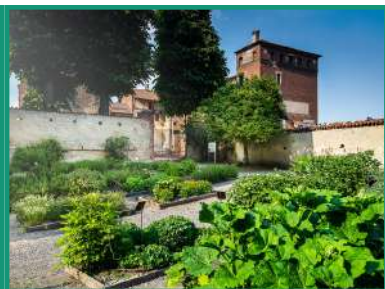
LAGNASCO GIARDINO DELLE ESSENZE