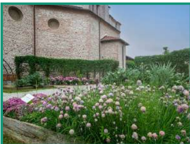
CHERASCO ORTO DEI PADRI SOMASCHI