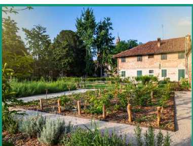
MARENE GIARDINO DELLA CASA DEL CUSTODE