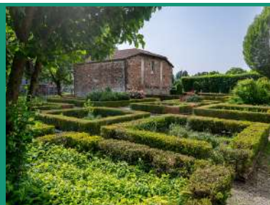
CAVALLERMAGGIORE GIARDINO DEI SEMPLICI