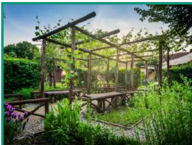
BENE VAGIENNA ORTO ROMANO