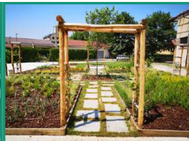
CAVALLERMAGGIORE ORTO TINTORIO